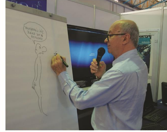
Mr George Wolinski Charlie Hebdo

L'équipe pédagogique de l'ILOI est composée d'un réseau d'une centaine de formateurs et intervenants professionnels locaux, nationaux et internationaux. L'ILOI peut s'enorgueillir d'avoir dès sa création pu compter sur les interventions de professionnels de réputation mondiale, du monde de la création et de la technologie numérique et de l'image.