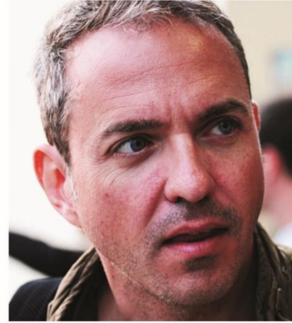
Kyle Balda animateur, réalisateur américain Ayant travaillé pour les Studios Pixar Actuellement co-réalisateur des Minions