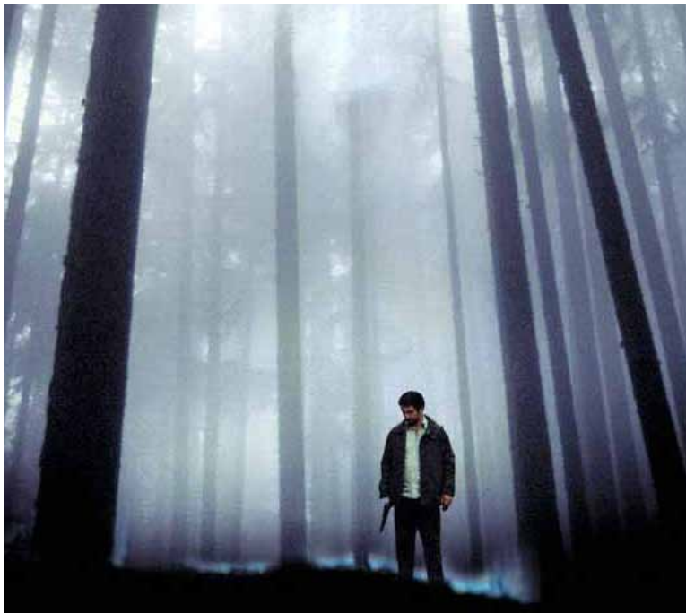
© Aura de Fabián Bielinsky 2006. Fiona Lindron

Réalisation inspirée du film noir, d'une vidéo, une photographie au sein d'un environnement urbain ou naturel.