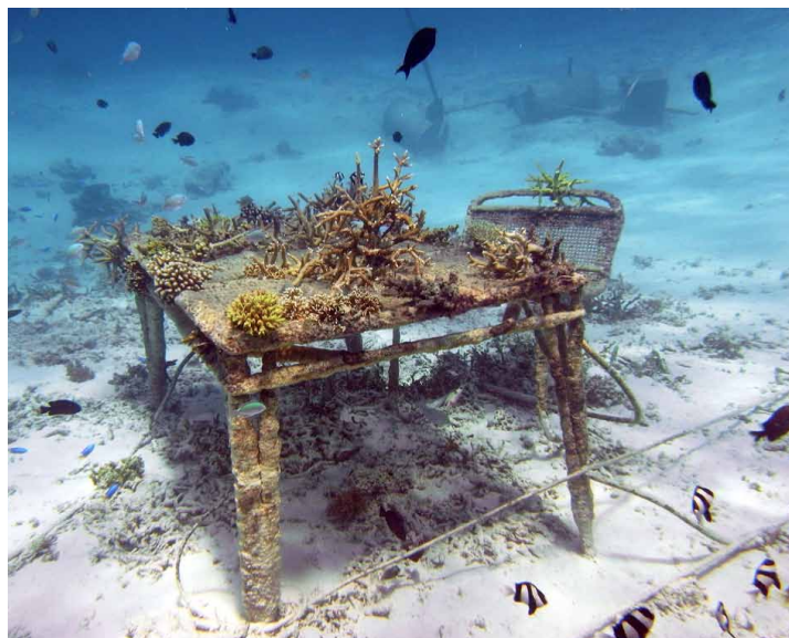
© Mineral Accretion Factory. David Enon

Concevoir, dessiner et mettre en production une gamme d'objets/mobilier/sculptures en "récif artificiel" selon le principe d'alterproduction "Minéral Accretion Furniture" et participer à la préservation du littoral (faune/flore) notamment par le développement des récifs coralliens.